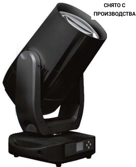
Поворотная всепогодная «голова» BEAM